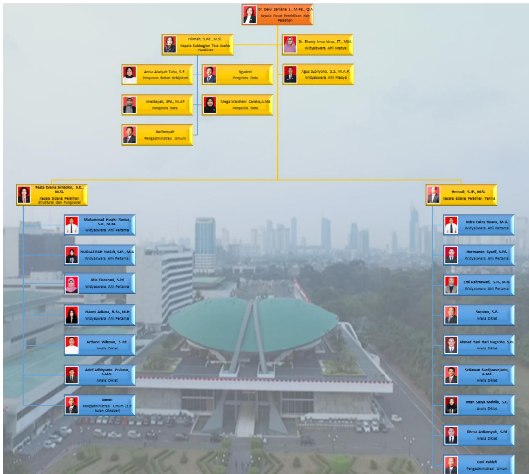
Bagan 1.1 Struktur Organisasi Pusdiklat Sekretariat Jenderal DPR RI

Struktur Organisasi Pusdiklat Sekretariat Jenderal