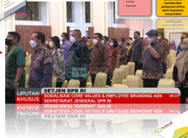
Buku Saku Panduan Prilaku Sesuai Core Values BerAkhlaq