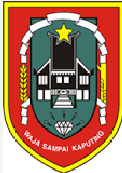
PROVINSI KALIMANTAN SELATAN