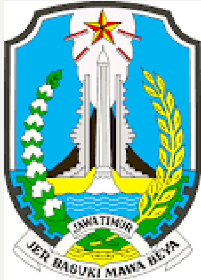
PROVINSI JAWA TIMUR