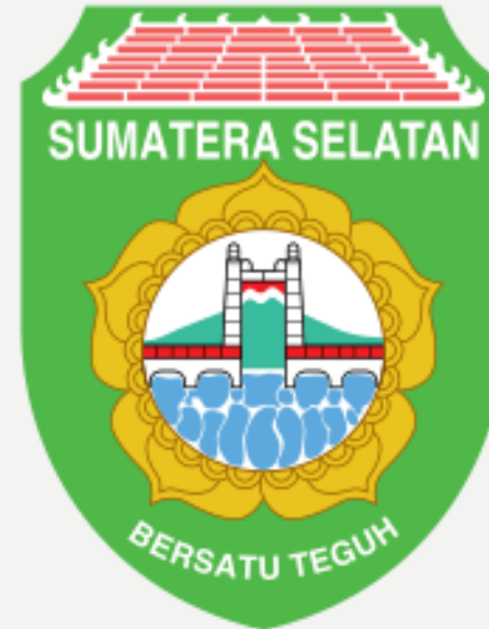
PROVINSI SUMATERA SELATAN