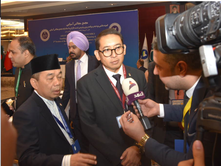
Ketua BKSAP DPR RI Fadli Zon saat menghadiri APA Standing Committee on Budget and Planning di Tehran, Iran, Selasa (11/07/2023).

B adan Kerja Sama Antar-Parlemen (BKSAP) DPR RI mengatakan bahwa forum Asian Parliamentary Assembly (APA) akan menguntungkan bagi Indonesia, khususnya dalam membangun konektivitas internasional. Hal tersebut diungkapkan oleh Ketua BKSAP DPR RI, Fadli Zon usai menghadiri APA Standing Committee on Budget and Planning di Teheran, Iran.