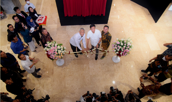
WAKIL KETUA KOMISI III DPR RI HABIBUROKHMAN SAAT MEMBUKA ACARA ANUGERAH KARYA JURNALISTIK III DAN PAMERAN FOTO WARNA WARNI PARLEMEN KE-13 DI SELASAR GEDUNG NUSANTARA II, JAKARTA, RABU (12/7/2023).