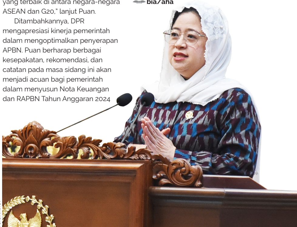
Ketua DPR RI Puan Maharani membacakan pidato penutupan Masa Persidangan V DPR Tahun Sidang 2022-2023 di Gedung Nusantara II, Kompleks Parlemen, Senayan, Jakarta, Kamis (13/07/2023).