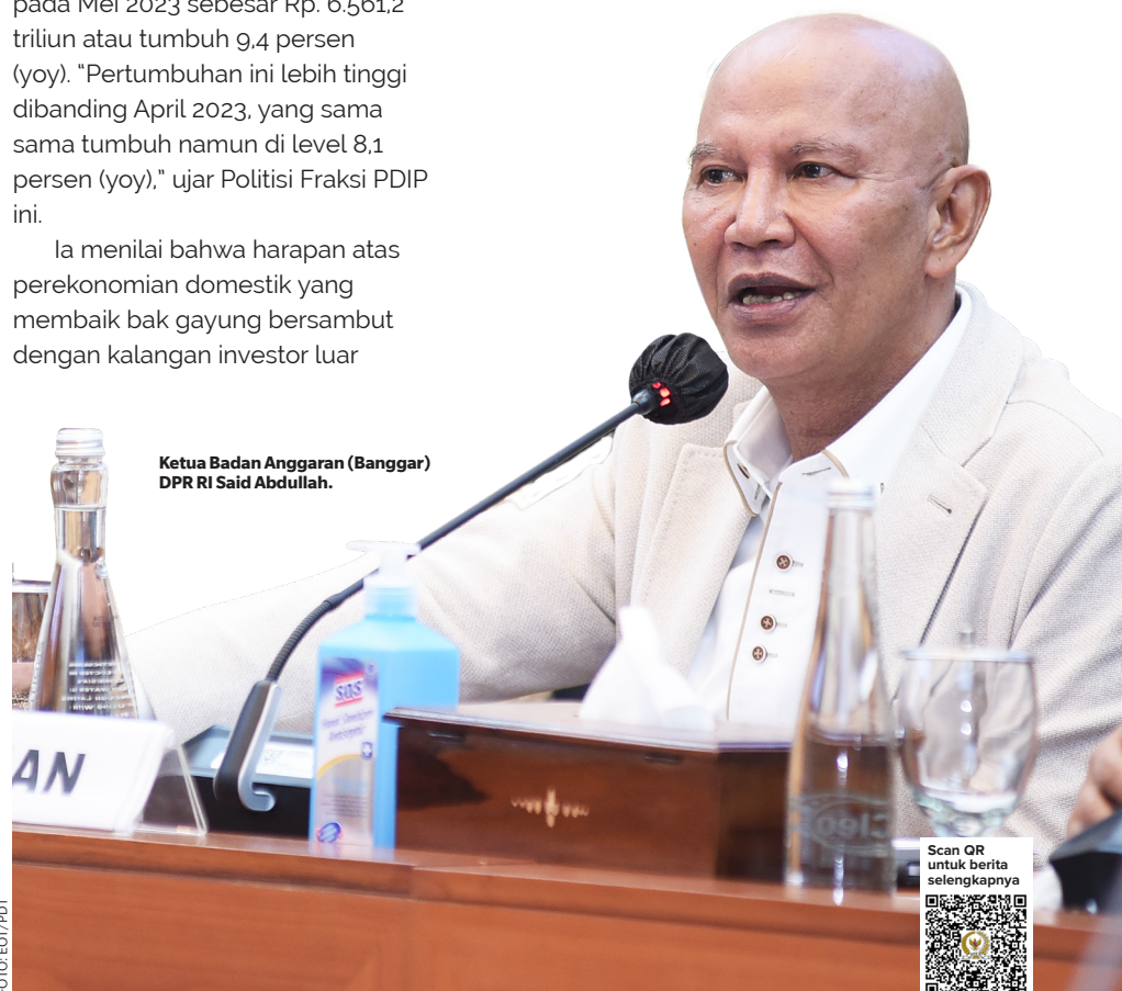
Ketua Badan Anggaran (Banggar) DPR RI Said Abdullah.