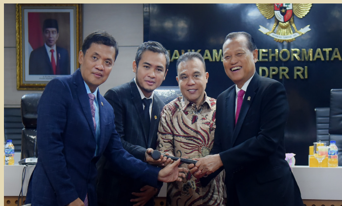
Imron Amin usai dilantik sebagai Wakil Ketua Mahkamah Kehormatan Dewan (MKD) DPR RI oleh Wakil Ketua DPR RI Sufmi Dasco Ahmad di Ruang MKD, Nusantara I, Jakarta, Senin (10/7/2023).