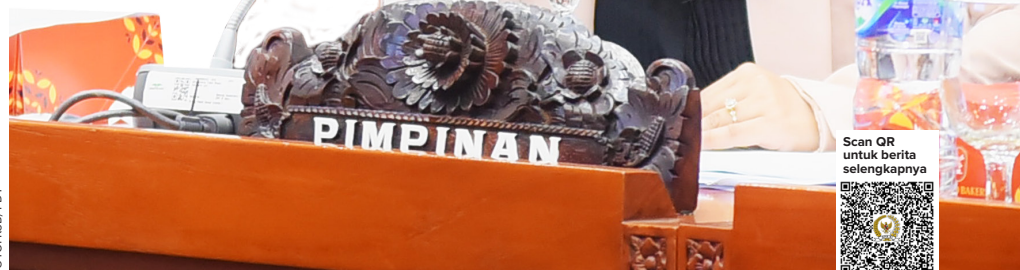
Ketua Komisi I DPR RI Meutya Hafid.

NEGOSIASI HARUS DIUTAMAKAN. PEMERINTAH DAN APARAT KEAMANAN INDONESIA HARUS BISA MEMASTIKAN KESELAMATAN SANDERA, TAPI SEKALIGUS TIDAK BOLEH MERENDAHKAN HARGA DIRI BANGSA.