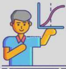
Gambar 2. Rata-Rata Realisasi Anggaran Kemensetneg 2017-2020