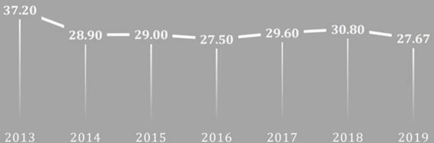
— Capaian Prevalensi Stunting (%)