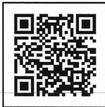
Gambar 6. Contoh QR Code Naskah Dinas Elektronik

Pada proses autentikasi Naskah Dinas Elektronik dilengkapi tampilan QR Code yang berisi informasi tautan dari Naskah Dinas yang ditandatangani secara elektronik. Ketika dilakukan pemindaian ( scan ) QR Code , maka akan dihubungkan ke tautan menuju Aplikasi TNDE sehingga dapat dilakukan perbandingan keaslian isi antara Naskah Dinas Elektronik yang terdapat di Aplikasi TNDE dengan Naskah Dinas Elektronik yang tercetak.