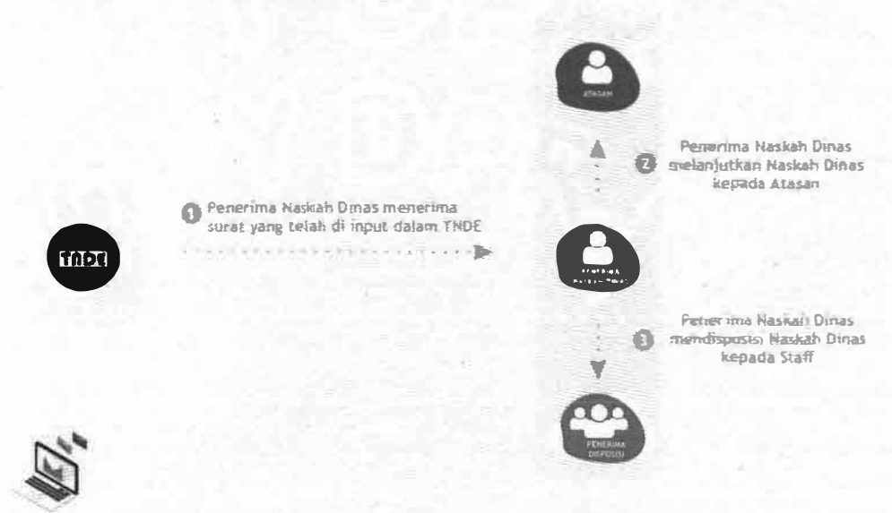
Gambar 3. Alur Disposisi