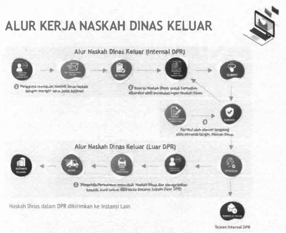
Gambar 4. Alur Naskah Dinas Keluar

Penjelasan alur Naskah Dinas keluar adalah sebagai berikut: