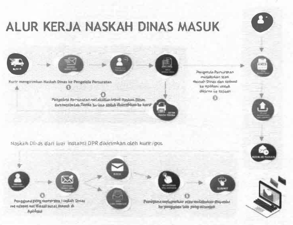
Gambar 2. Alur Naskah Dinas Masuk

Berikut merupakan Alur kerja Naskah Dinas Masuk: