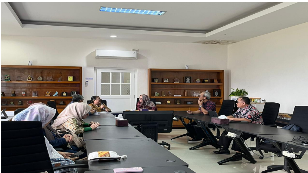
Suasana Rapat Koordinasi Tim Advance Biro Kerja Sama Antar Parlemen dengan Pengelola Lembaga Kawasan Sains dan Teknologi IPB University