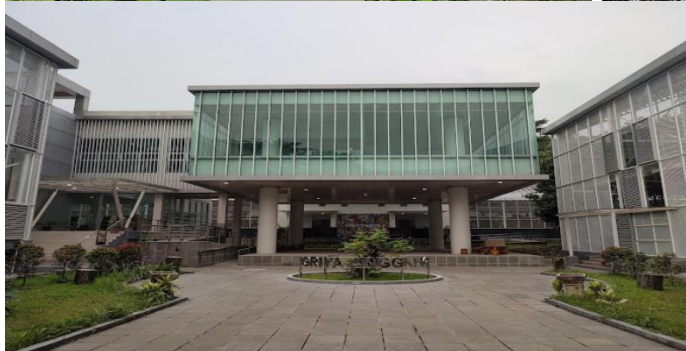
Griya Anggrek Kebon Raya Bogor