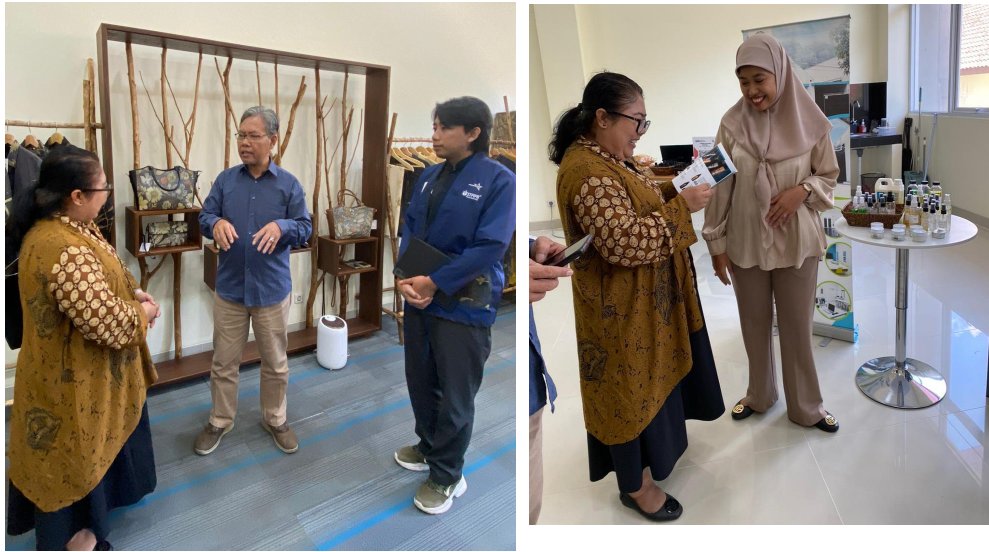
Peninjauan hasil produk kerajinan, kebutuhan rumah tangga dan makanan yang dikembangkan oleh LKST