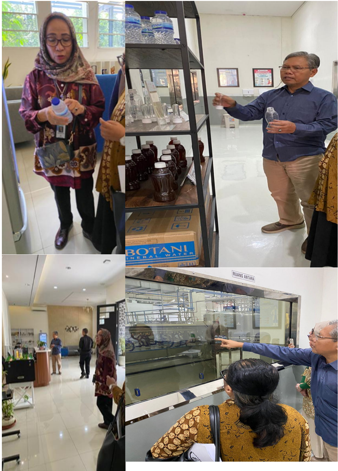
Peninjauan hasil produk minuman air mineral kemasan BOTANI yang dikembangkan oleh LKST

Begitu juga di Lantai 3 juga terdapat berbagai ragam produk dari berbagai Startup. Bahkan ada Startup terkait konsultasi keuangan bagi orang yang ingin membangun suatu Perusahaan atau suatu bisnis dengan model permainan seperti ular tangga.