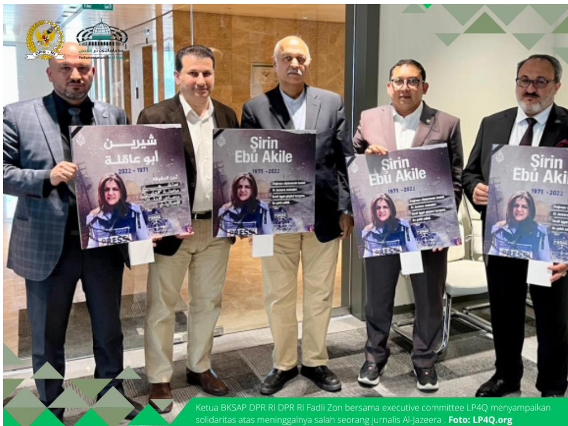
Ketua BKSAP DPR RI DPR RI Fadli Zon bersama executive committee LP4Q menyampaikan solidaritas atas meninggalnya salah seorang jurnalis Al-Jazeera.