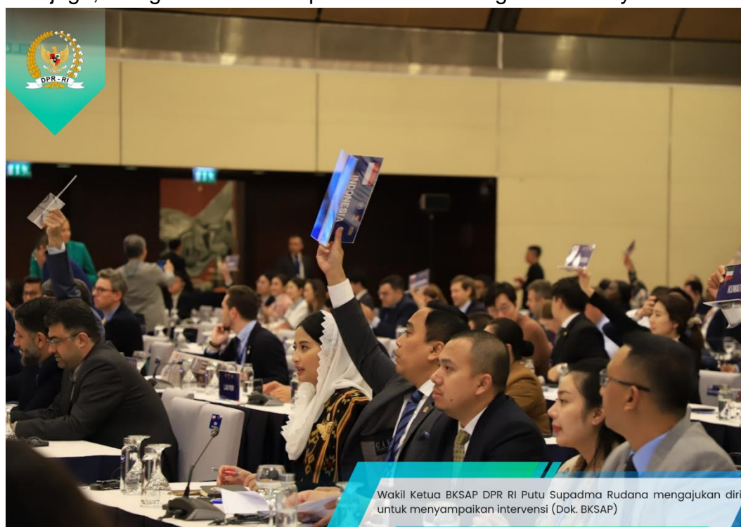
Wakil Ketua BKSAP DPR RI Putu Supadma Rudana mengajukan diri untuk menyampaikan intervensi

Politisi dari Bali itu juga menyampaikan bahwa keanekaragaman budaya yang ada di Indonesia juga dijaga berdasarkan pasal 32 Undang-Undang Dasar Negara yang mengatur bahwa Negara mengembangkan kebudayaan nasional Indonesia di tengah peradaban dunia dengan menjamin kebebasan masyarakat untuk memelihara dan mengembangkan nilai-nilai budayanya. Selanjutnya DPR RI juga mengesahkan Undang-Undang Nomor 5 Tahun 2017 tentang Pemajuan Kebudayaan yang mengakui dan menghormati keberagaman budaya Indonesia sebagai landasan kebudayaan nasional. Undang-undang ini juga bertujuan untuk menjaga, mengelola dan memperkuat keanekaragaman budaya Indonesia.