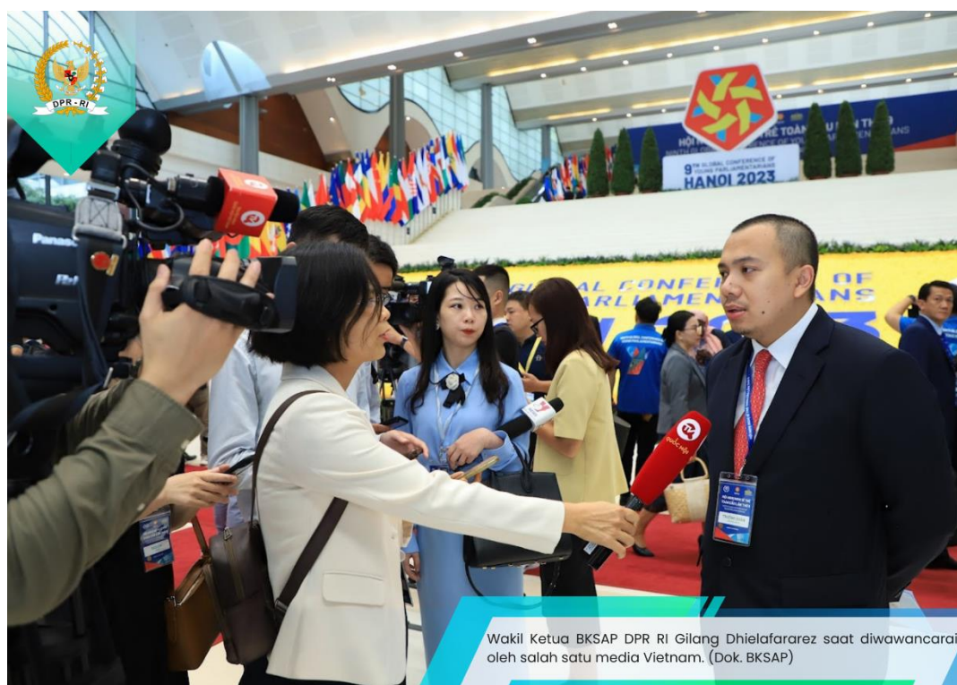
Wakil Ketua BKSAP DPR RI Gilang Dhielafarez saat diwawancarai oleh salah satu media Vietnam.

Gilang juga menyampaikan bahwa dengan jumlah penduduk sebesar 144,87 juta jiwa, yang merupakan 53,81% dari jumlah penduduk, generasi muda akan memainkan peran penting dalam transformasi digital di Indonesia. Menurutnya, generasi muda juga akan menjadi pusat transformasi melalui berbagi “pengetahuan” digital kepada seluruh masyarakat. Oleh sebab itu menurutnya, sangat penting bagi parlemen untuk mendukung agenda transformasi digital.