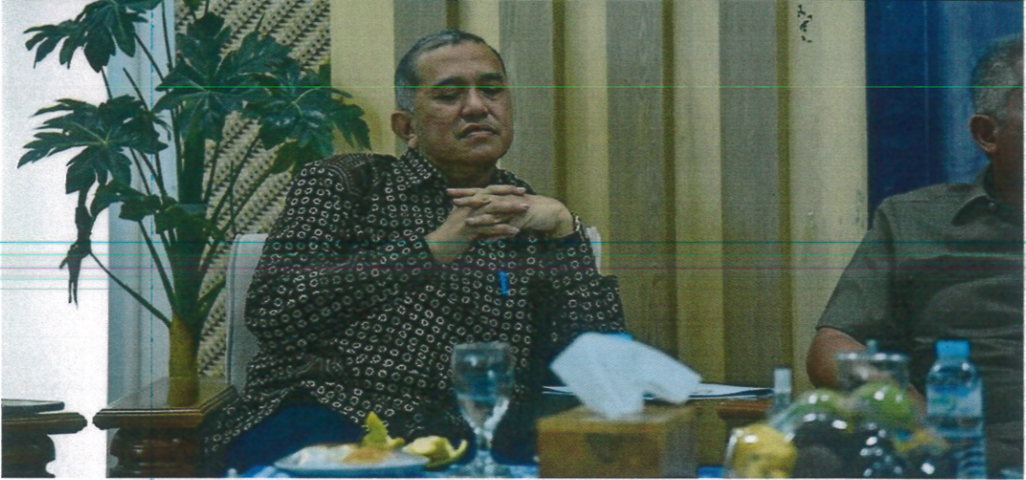
Sejumlah Anggota BKSAP turut hadir dalam BKSAP Day UMS