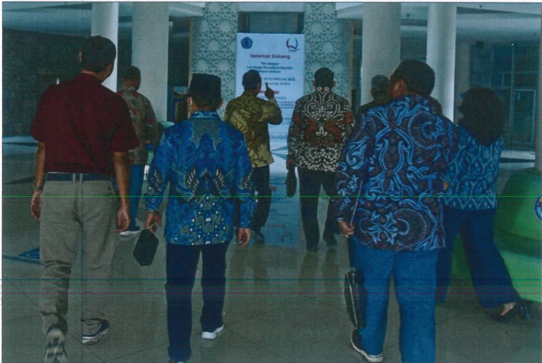
Ketua BKSAP Saat Tiba di Gedung Induk Siti Walidah UMS