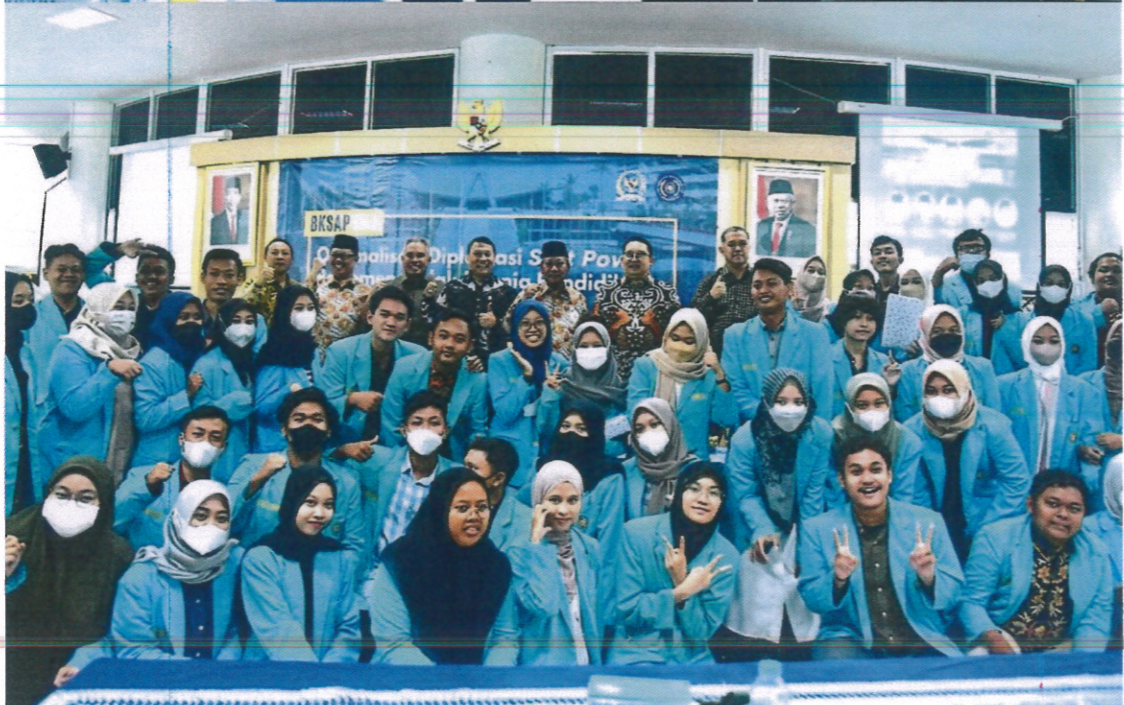
Pemberian Cenderamata kepada Rektor UMS dan Foto Bersama Mahasiswa