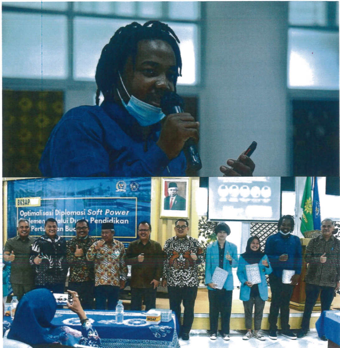
Sesi Tanya Jawab dan Pemberian Souvenir kepada Mahasiswa