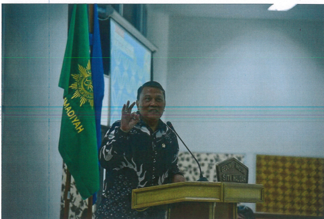
Wakil Ketua BKSAP DPR Dr. Mardani Ali Sera Menyampaikan Paparannya

Usai pembukaan dari moderator dilanjutkan pemaparan terkait tema kunjungan ke UMS. Di awal paparannya Dr. Mardani Ali Sera merasa terkesan dengan tiga nilai yang diusung UMS yaitu humanisasi, liberasi dan transendensi. Menurut dia tiga nilai tersebut dapat membuat membuat Indonesia menuju berkemajuan.