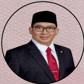
Dr. H. Fadli Zon, S.S., M.Si F-P-Gerindra/A-86 Ketua BKSAP | Anggota Komisi I

Susunan Delegasi DPR RI ke Briefing Session bersama WFD dan Global Affairs Canada adalah sebagai berikut: