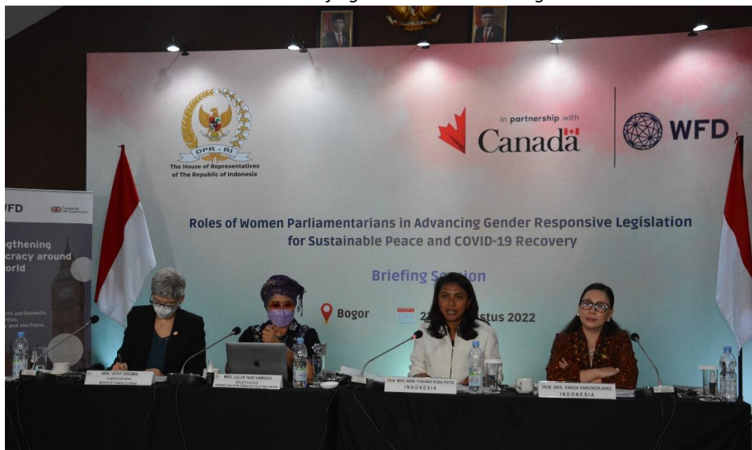
Panelis yang hadir secara fisik