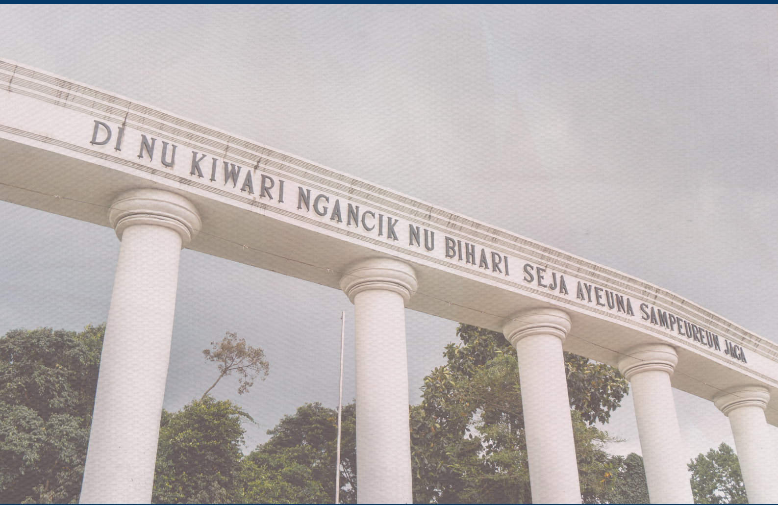
Lawang Salapan, Bogor.