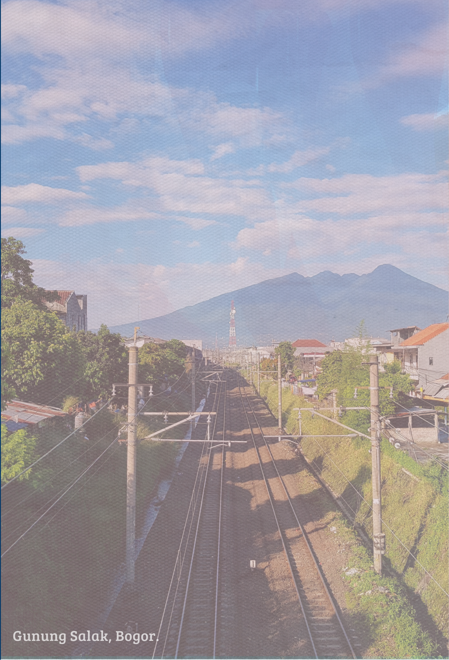
Gunung Salak, Bogor.