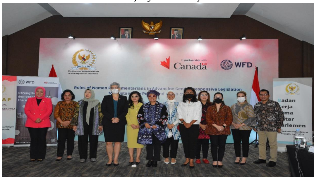
Foto bersama pasca kegiatan Briefing Session