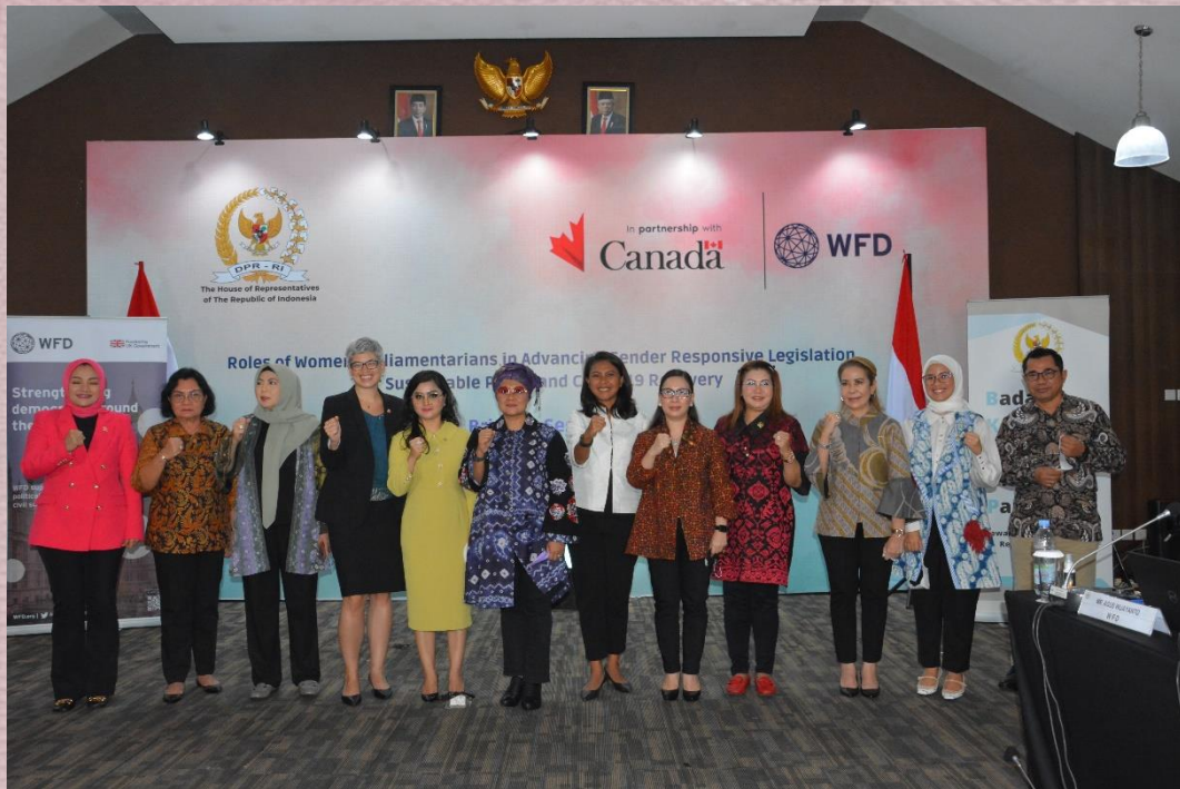
Peserta Briefing Session berfoto bersama setelah pelaksanaan kegiatan